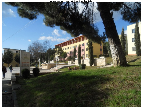
zona e finishit