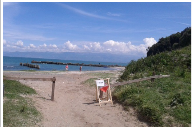
zona e finishit