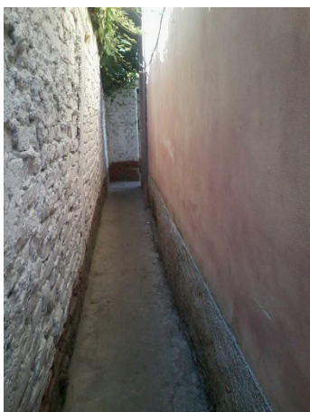
Nel labirinto del Qytet studenti