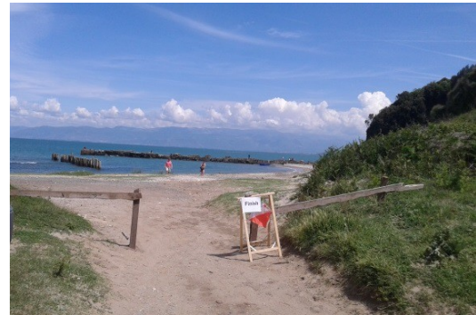
Zona e finishit