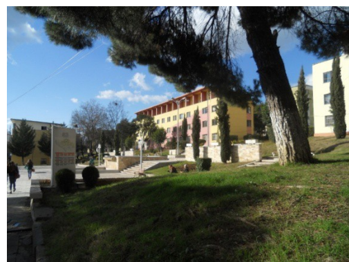
Zona e Finishit