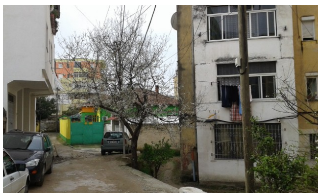
Dans le labyrinthe de Qytet studenti